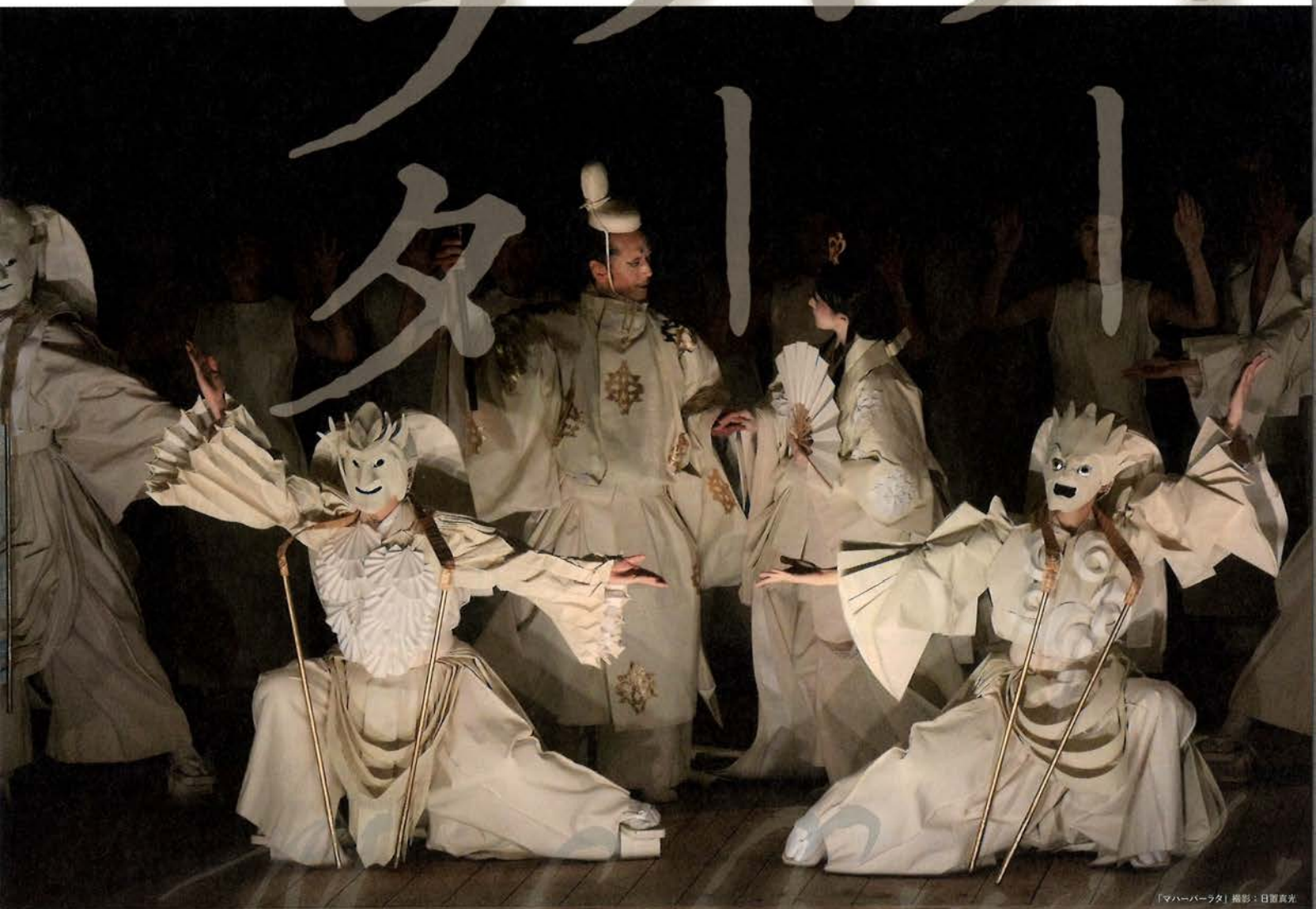
「マハーバーラタ」

時空を超えたアートの世界 ART COLLABORATION IN NARA BEYOND TIME AND SPACE