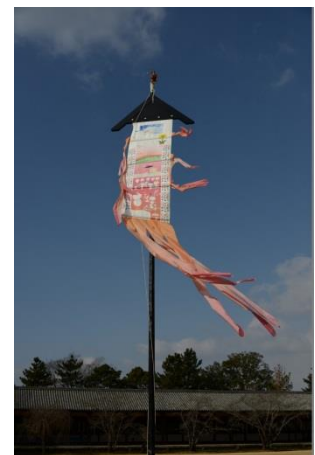
ビッグ幡プロジェクト イメージ

また、シンポジウム関連企画として、『東アジア ビッグ幡プロジェクト in 東大寺』も開催します。巨大な旗「ビッグ幡」が10月16日(日)から23日(日)まで東大寺参道に掲揚されますのでお楽しみに。