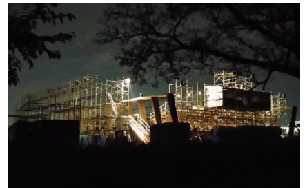
平城宮跡に出現した巨大劇場