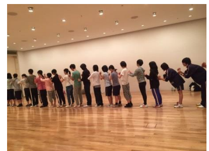
オーディションの様子

『高校生と創る演劇』は、ならまちセンター市民ホールで開催します。ぜひご来場ください。