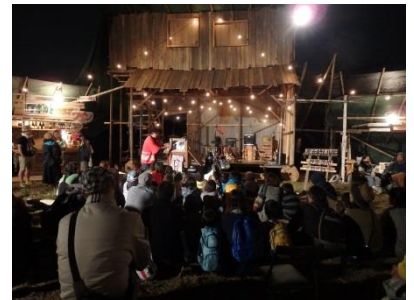
屋台村にも多くの来場者が