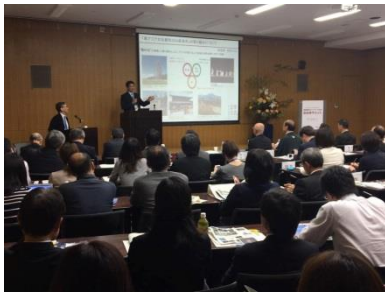
フォーラムで「古都祝奈良」を紹介

一行からは、「しっかりと保存されている文化財と現代アートが美しく調和している」と感想をいただくなど、世界遺産を舞台に繰り広げられている古都のアートプロジェクトを堪能され、奈良を後にされました。