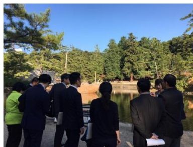
「古都祝奈良」の会場を見学する一行(左:東大寺、右:春日大社)