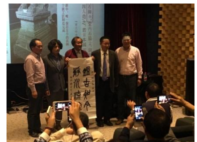
感謝の意を込めて「書」が贈呈されました