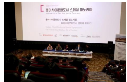
シンポジウムでの意見交換

12月21日（水）には若草公民館でも上映会（主催：きたまち食と文化を考える会）が開催されますので、ぜひご覧ください。