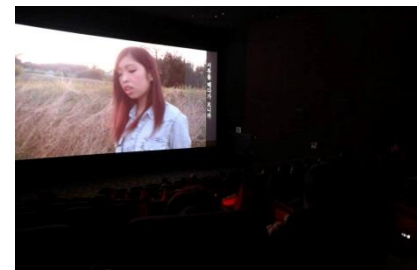
向井監督の作品を上映